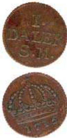
1 Daler silvermynt. De första nödmynten, Cronan , utgavs 1715. Upplagan var 2,2 miljoner och vikten 3.6 gram.

S.M. på ena sidan och bilden av en krona på den andra (Bild 1).