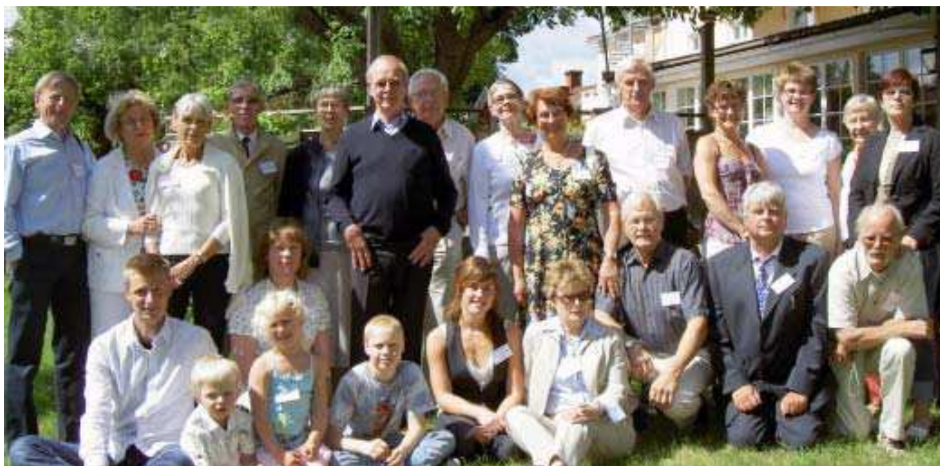
Släkträff för Charlierättlingar i Gränna 2007.