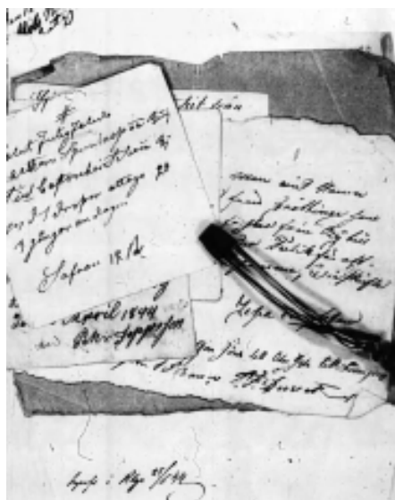
Exempel från Engdahls lappar med bl.a. recept. Från Genline.

Carlqvist har varit medveten om att Schönbeck varit “verkligt indignerad och därför icke skrätt sina ord” men avslutar sitt porträtt av Engdahl med orden: