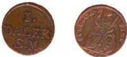
År 1716 utgavs Publica fide i en upp-laga av 38 milj och med vikten 7,6 g.

märckte med en Crona, intet komma således längre at wara gångbare uti Wårt Rike än til den 1. Maji nästkommande; Hafwandes Wi imedlertid låtit göra den nådige förordning at alla de som nu hafwa detta slagz Myntetehn i förråd, skola dem samma till wåre Ränterier inom föresagde termin af den 1. Maji utwäxla, antingen emot reda penningar eller wåre Ständers Obligationer, der Summan ansenlig är eller de senare Myntetehn af en Daler Silfwermynts wärde, sittande på andra sidan emot valeur-stämpelen en Bild, och kring om randen af penningen desse ord: Publica fide, eller ock emot Wårt Contributions Ränteries mindre Zedlar å 5. 10. och 25. Daler Silfwermynt stycket.