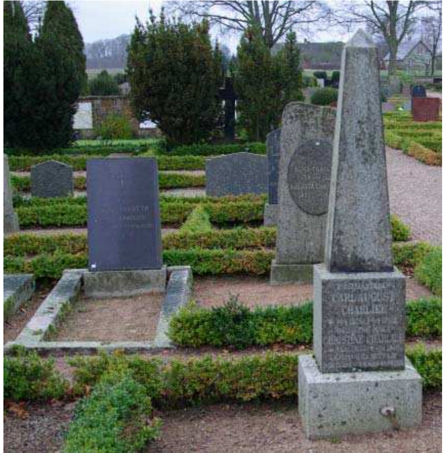
Gråmanstorps kyrkogård med fyra Charlier-gravstenar

1882 avled Carl August, vid 55 års ålder, av cancer ventriculi. Då var den yngsta dottern bara 6 år. Några år