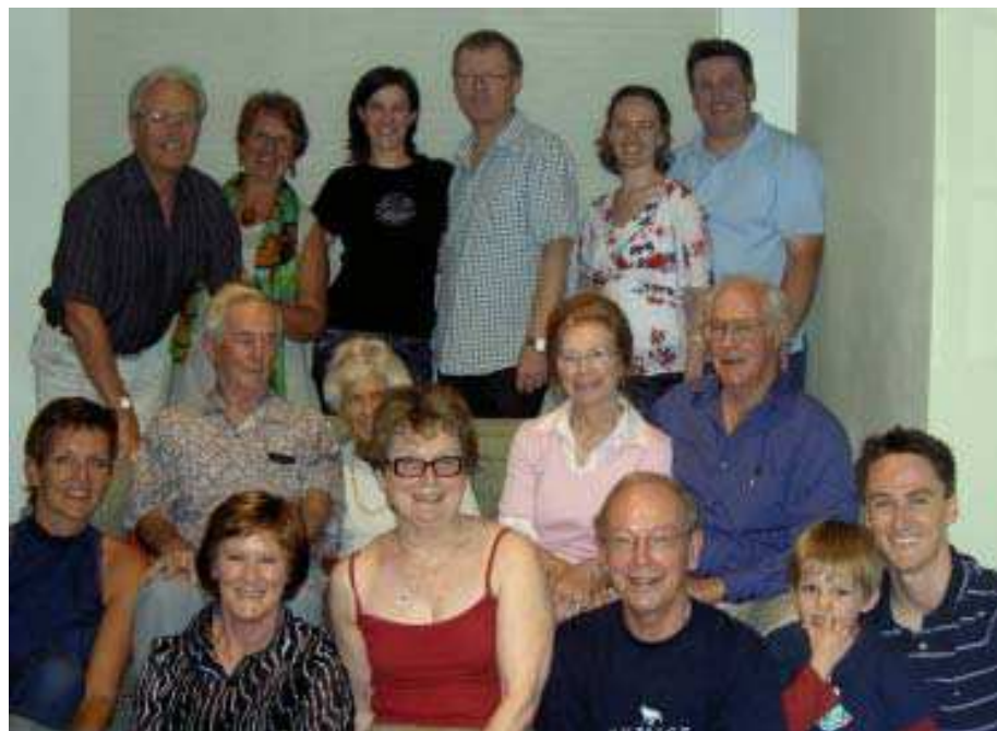
Charliersläktingar i Sidney, Australien 2007