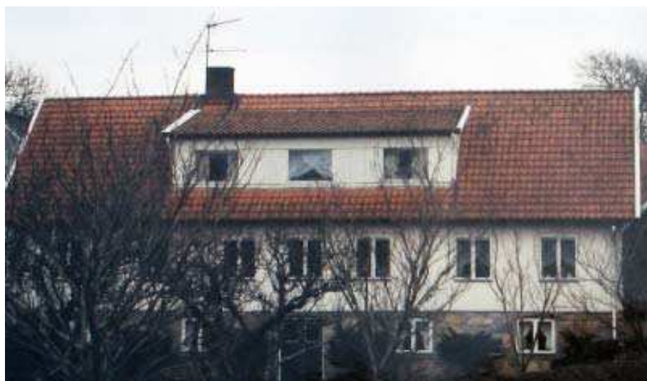
Den nutida gården Tåstarp 12.

Förr fick man efternamn efter sin far. Det blev Carlsson och Carlsdotter. Soldater och hantverkare använde ofta andra efternamn som ibland ärvdes men ibland bara försvann...och i detta fallet komma tillbaka. Anita berättar om sin farfars anor och deras efternamn.