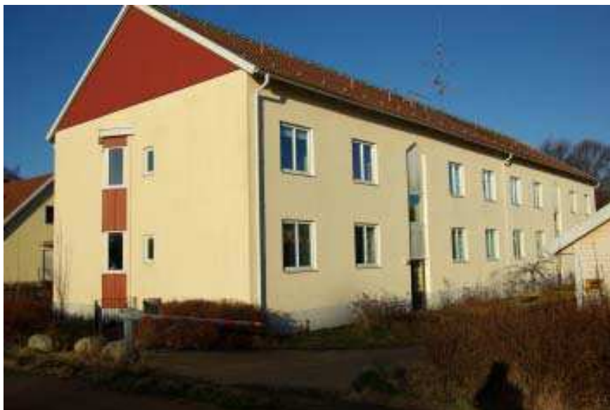
Huset i Pappersbruket där föreningen hade sin lokal i källaren.

Egen lokal fick vi 1991 ute vid pappersbruket, lokalen invigdes vid årsmötet den 9 februari samma år. På bruket var vi kvar till 1993 då vi fick möjlighet att hyra lokal i centrum av Klippan, på den då alldeles nyinvigda studiegården 47:an där vi sedan dess hållit till. De första åren huserade vi i bottenvåningen, men 1995 hade vi