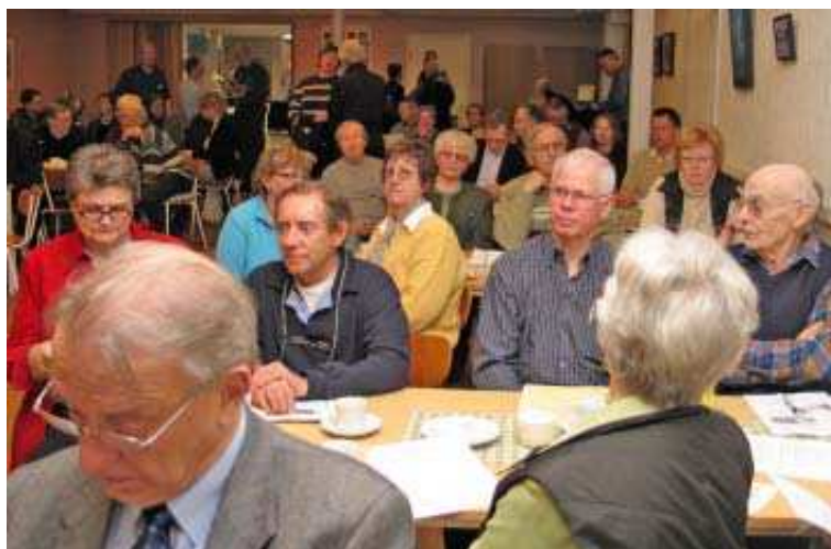
Åhörare på DIS-Syds årsmöte våren 2006