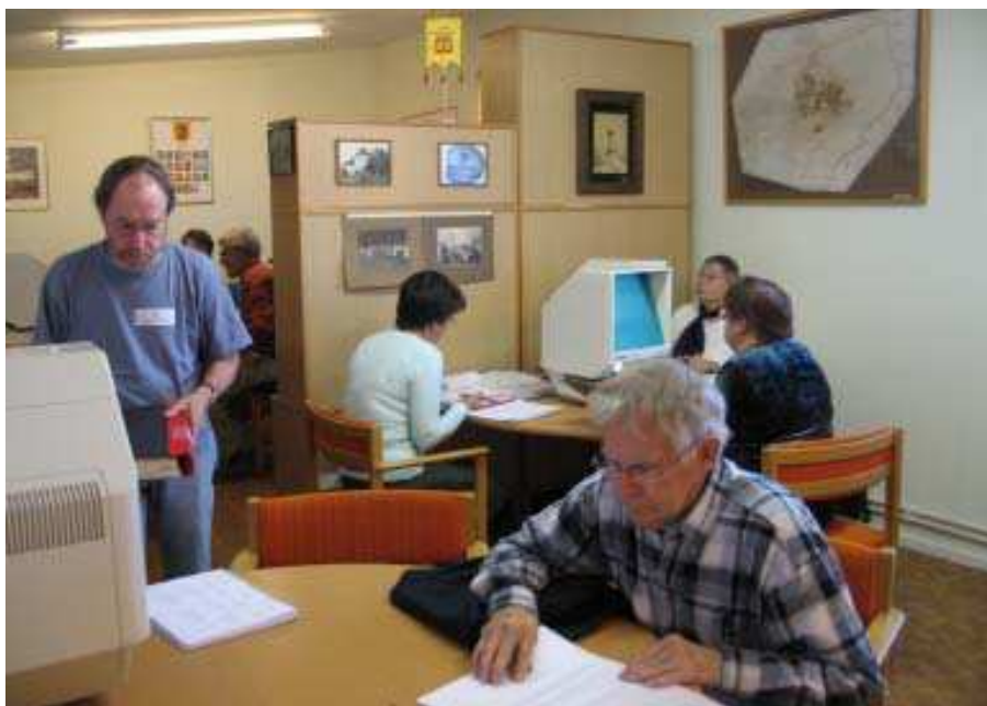
Släktdag i vår ombyggda lokal okt 2005