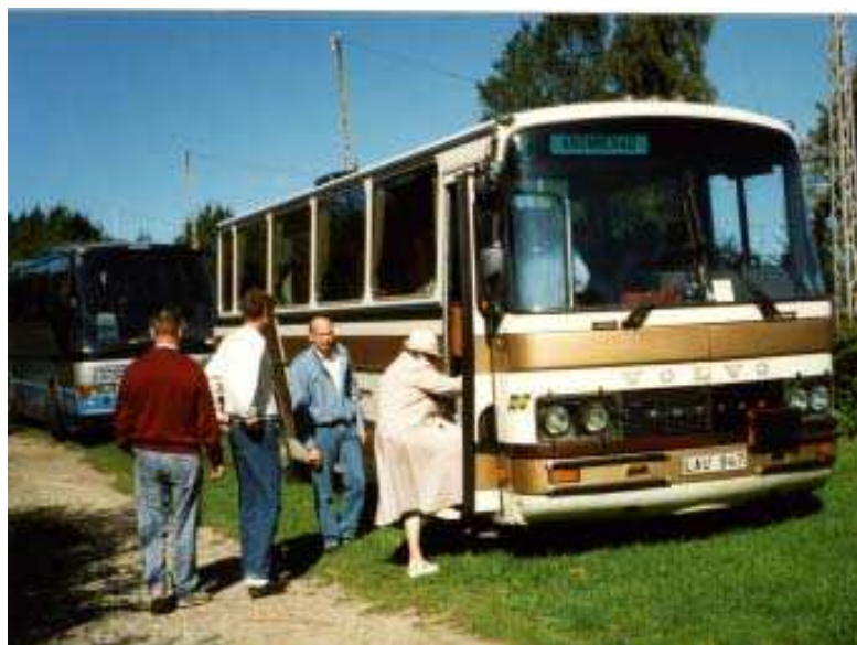
Bussresa till Lyngby