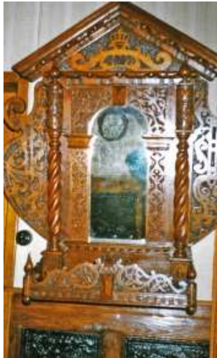
Del av den gamla predikstolen

De två åren mellan det att man rev den gamla kyrkan tills den nya stod