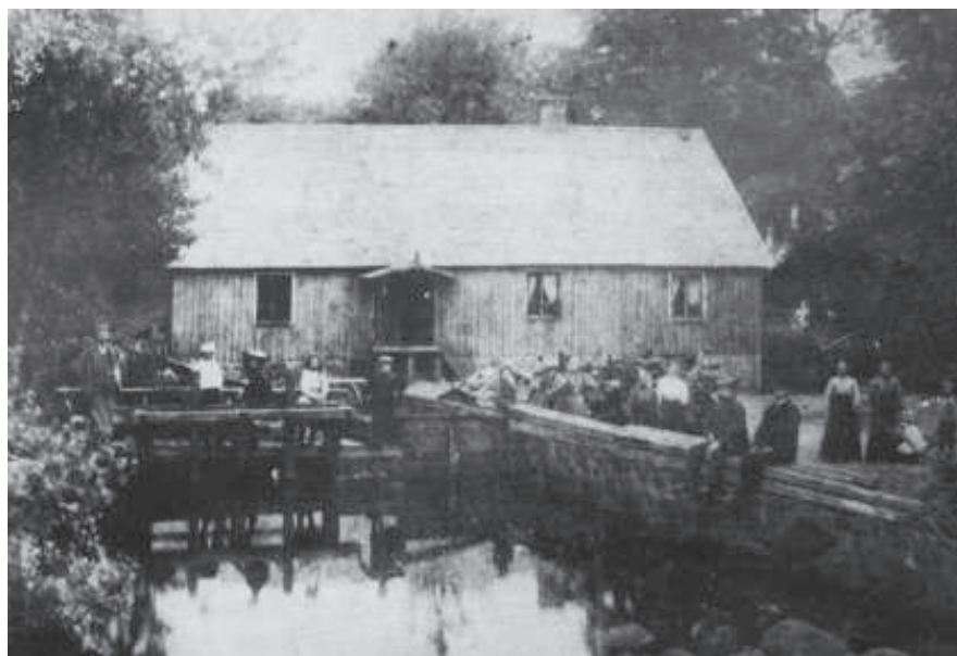
Klöva mölla c:a 1903