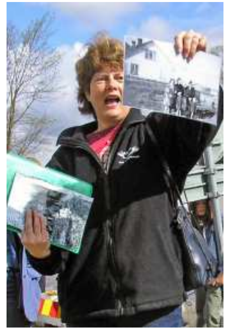
Jag gillar att ordna släktturer.