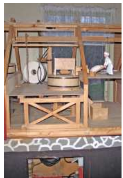
På möllan fanns en modell av möllan i genomskärning.

Därefter for vi vidare till Oderljunga mölla där vi besökte museet och fikade.