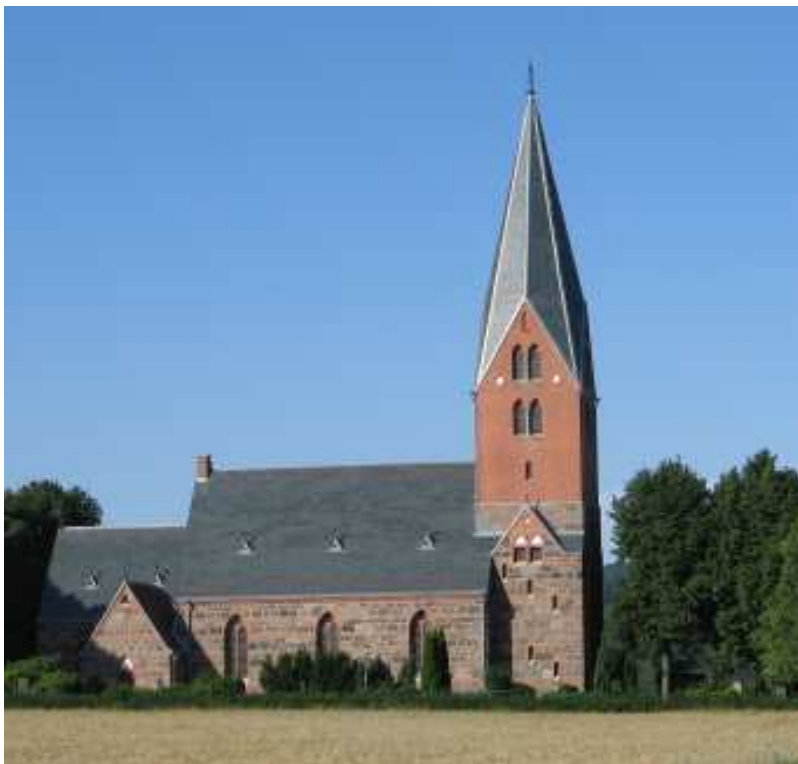
V. Sönnarslövs nya kyrka

Sönnarslöv i Kristianstads län, S.Åsbo hd. Sn strax s. om Klippans jernvägsstation mellan Söderåsen i s. och s.v. samt Rönneån i n. och n.o. Exercisfältet Bonarps hed tillstötter på s.ö. sidan. 0,217 qv.-mil, hvaraf land 0,215 eller 4,973 tald, 12 ½ mtl, 1,369 inv., 966,900 kr. fastighetsvärde.