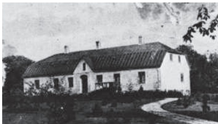
Dragesholm på 20-talet Ur Stenestadboken

* " hartkorn " = sammanfattande benämning på råg, vete och korn, äldre skattnorm