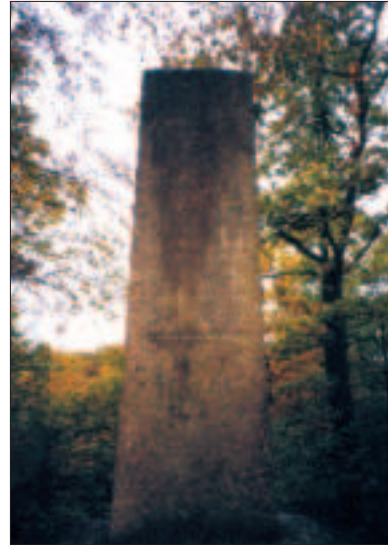
Minnesstenen