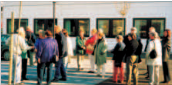
Samling utanför Arkivcentrum Syd

20 st. nyfikna släktforskare samlades utanför Arkivcentrum Syd på Porfyrvägen 16, Lund, onsdagen den 14 maj 2003.