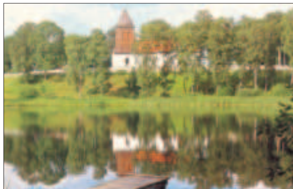
Örkelljunga kyrka med Prästsjön i förgrunden

När Fante blev ihjälslagen lyfte klockan från stockverket, flög upp i luften och ner i Prästsjön.