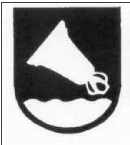
Örkelljunga kommunvapen Sambandet är inte långsökt.