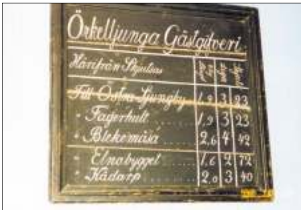
Skjutstavlan, som finns i Gästgiveriets foajé

kommo körande uppåt med sina produkter, spannmål och annat.