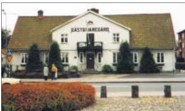
Gästgiveriet år 2002

För övrigt rådde det ganska egendomliga förhållandet i Örkelljunga, att det fanns tvenne gästgivaregårdar där. Från början har det endast funnits en – den som nämndes här ovan – men så har stamhemmanet, vid vilket gästgiveriet varit bundet, blivit delat tillika med tillhörande rättigheter och på så sätt ha tvenne gästgivaregårdar uppstått. Ända till 1829 lågo dessa nästan alldeles intill varandra, det var bara landsvägen som skilde dem åt. Men sagda år brann nuvarande Rosengrens hotell ned och det var inte långt ifrån att Johanssons också strukit med. Hettan var så stark att fönsterrutorna smälte ned på det sistnämnda stället. Det antogs, att en lyckta, som man kvarglömt vid tröskningsarbete dagen förut, varit anledningen till den förhärjande branden. Enligt en ny förordning fick inte den nedbrända gäst-givaregården återuppbyggas så nära den andra som förut och med anledning härav ligger nu Rosengrens hotell något längre från vägen.