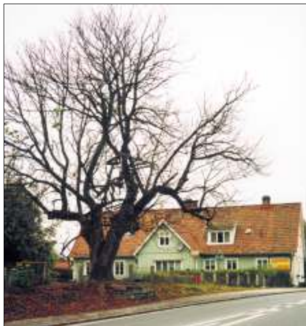
Kastanjen på baksidan av Gästgiveriet Foto Sten Svensson år 2002