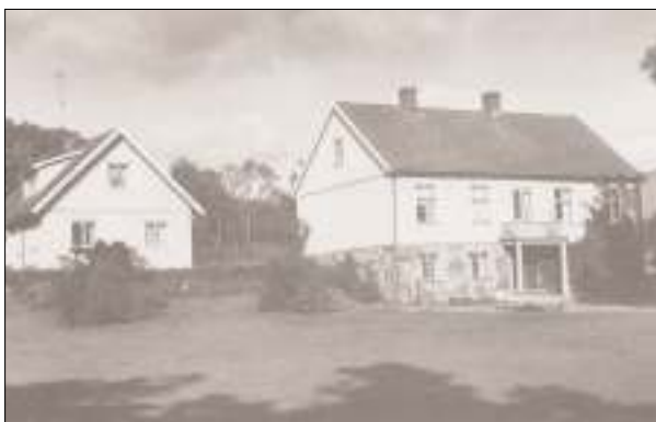
Lärkesholms säteri Direktionsbyggnaden till höger, uppförd på 1880-talet. Skogvaktarebostället till vänster.