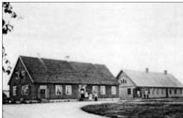
Gästgiveriet år 1900