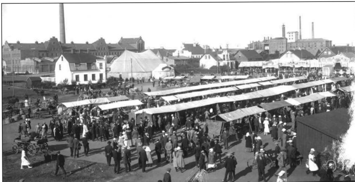
Åby marknad i början av 1900-talet.