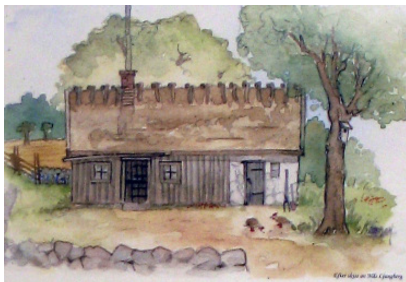
Trulsatorpet Magleröd Teckning av Nils Ljunggren, Färgsatt av Jim Julin