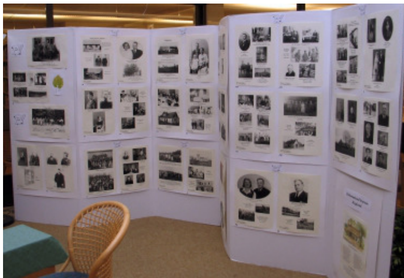
Utställningen på Klippans bibliotek

Frågan, som inte är besvarad är, vem stod modell till "lille Havfruen"?